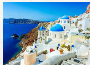
VALLENTINA AVIZ GRÉCIA