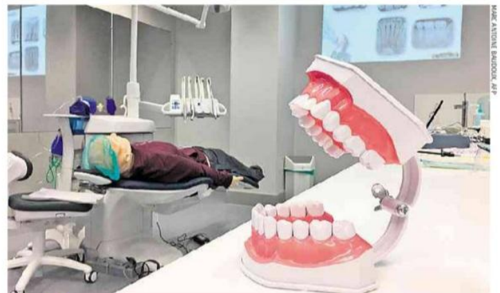
MARK ALVINE BARROUX/419

Evaldo teve papel de destaque no longo e desgastante processo de emancipação dos Bombeiros, que eram vinculados à Brigada e hoje têm autonomia administrativa e operacional.